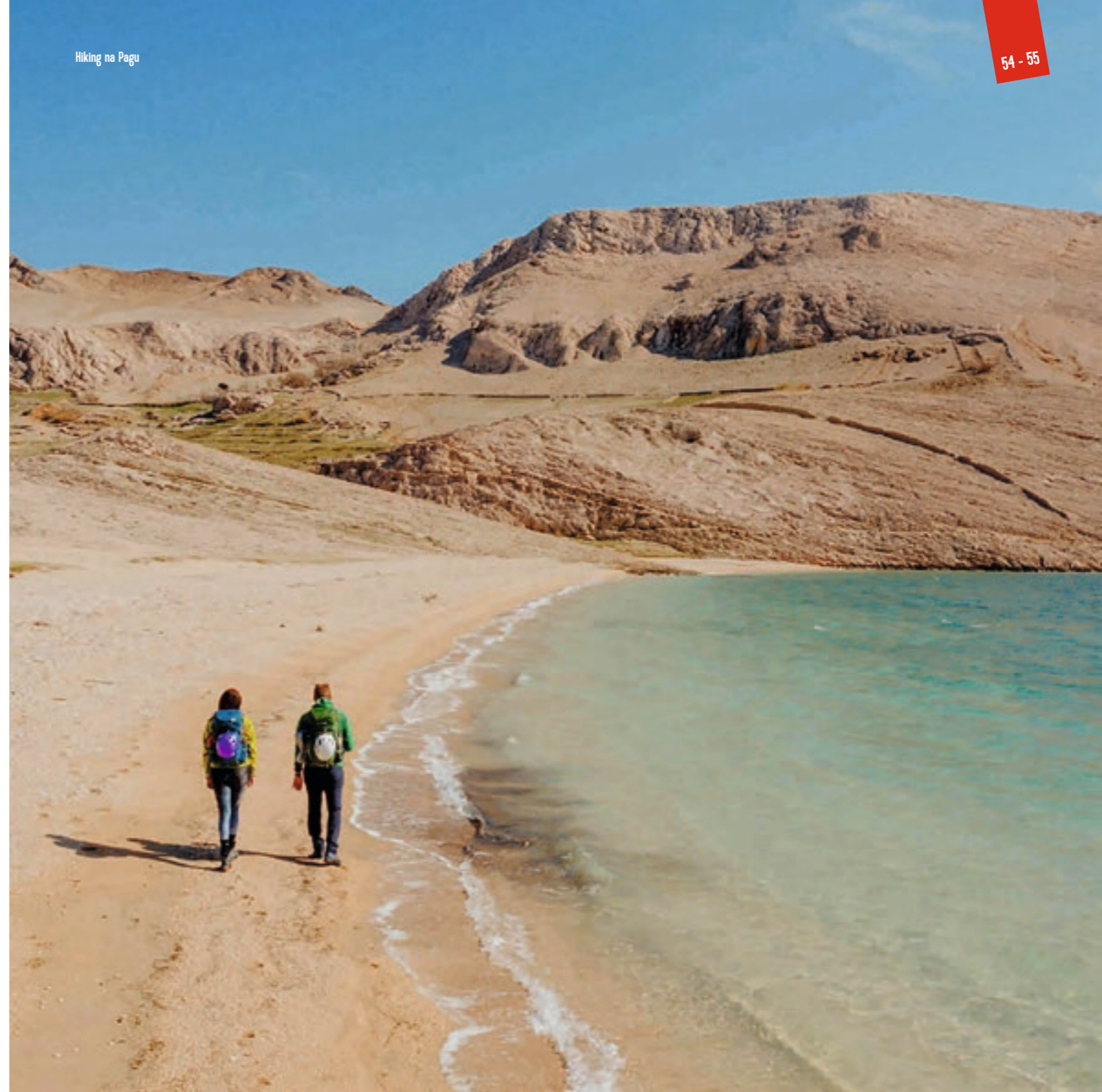
Hiking na Pagu