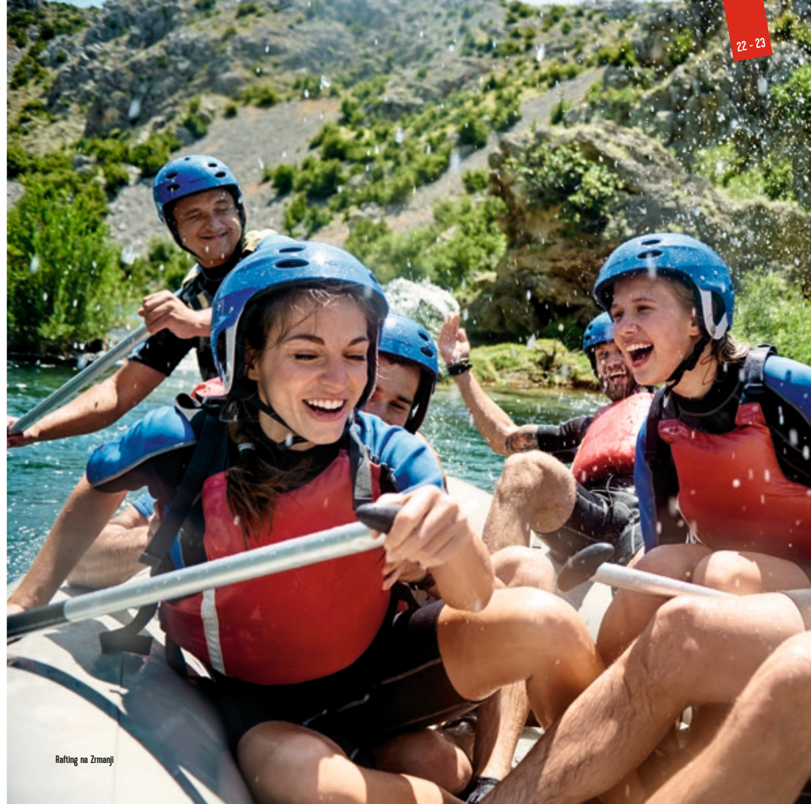
Rafting na Zrmanji