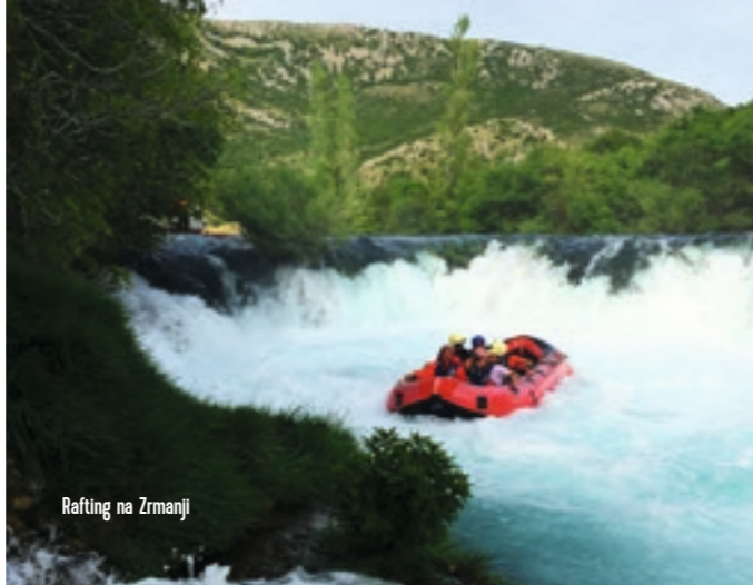
Rafting na Zrmanji