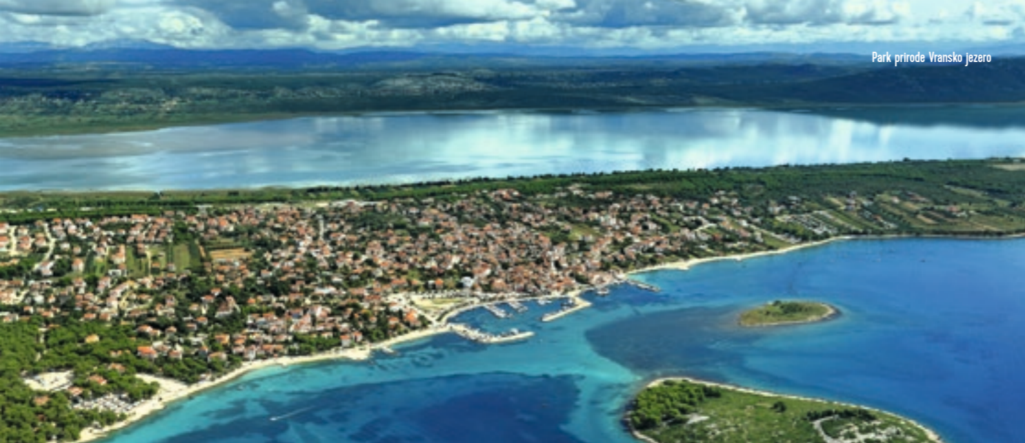
Park prirode Vransko jezero