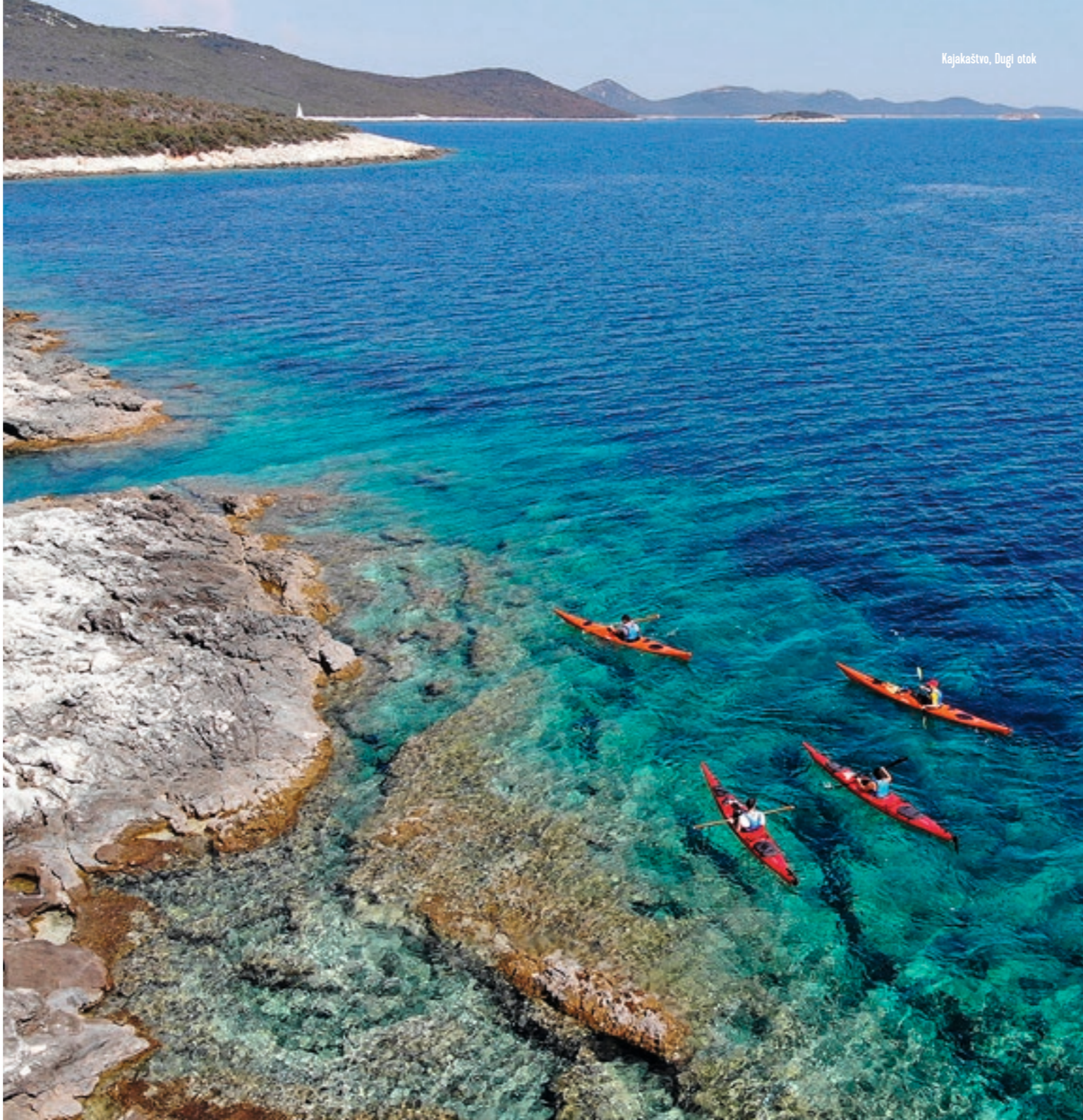
Kajakaštvo, Dugi otok