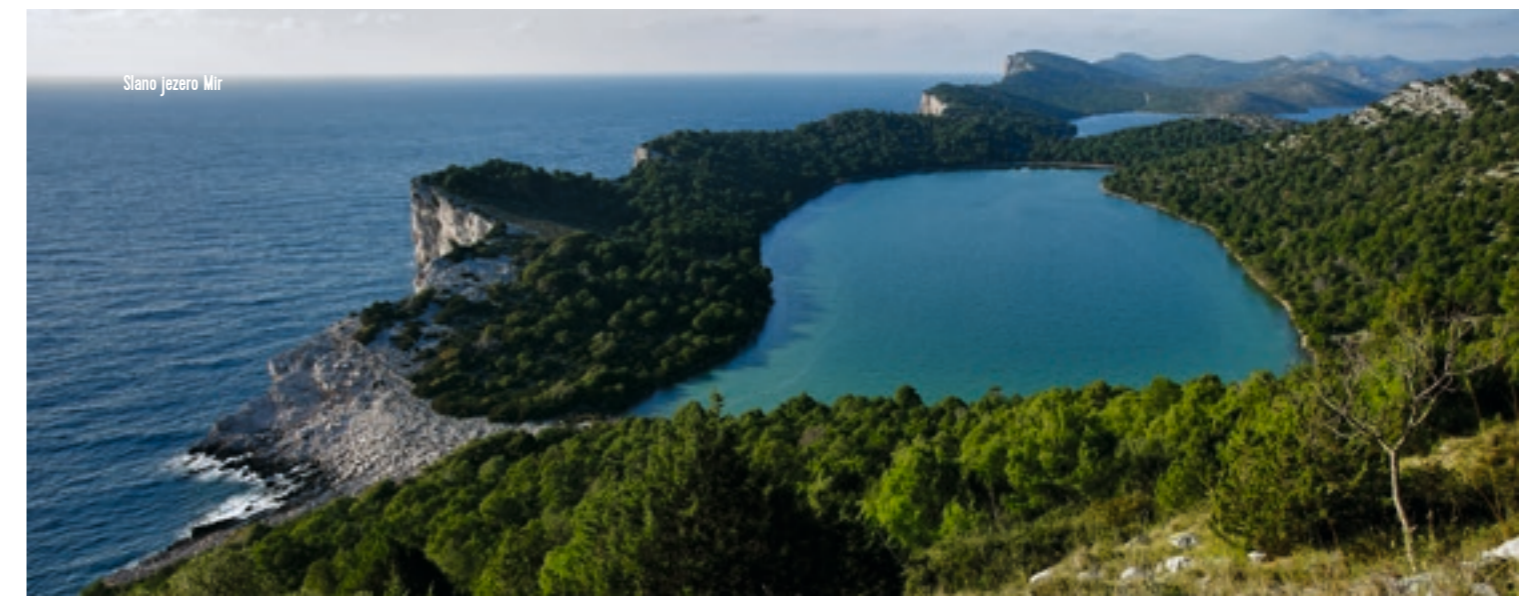
Slano jezero Mir