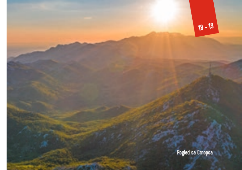
Pogled sa Crnopca