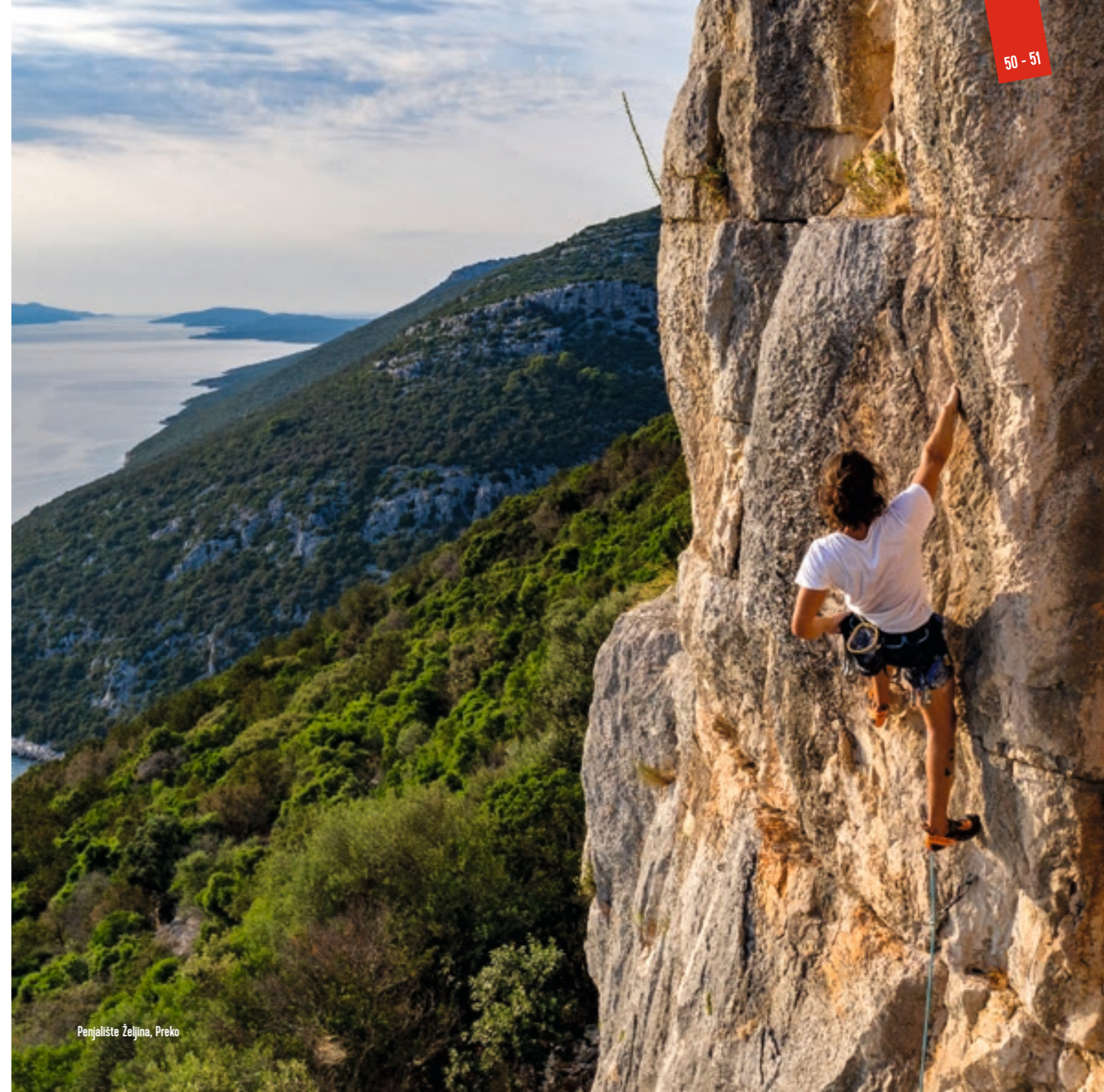
Penjalište Željina, Preko