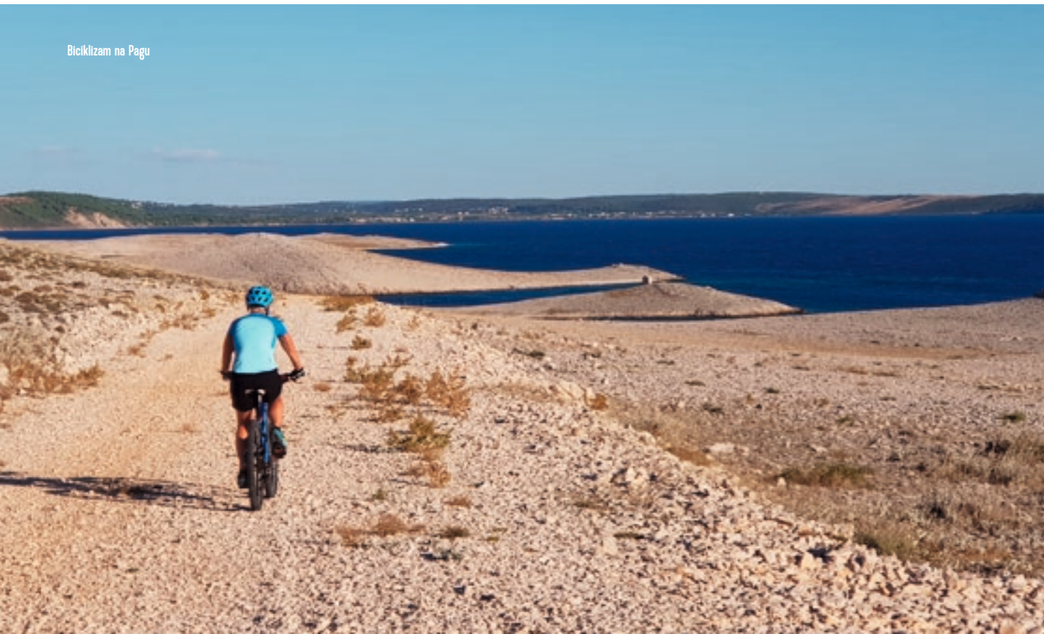
Biciklizam na Pagu

Ova neobična površina, rezultat je vječne igre između prirode i elemenata. Svaka stijena, svaki kamen, svaka dolina na Pagu priča priču o vječnoj borbi između prirode i elemenata. Ova neobična površina čini Pag idealnim mjestom za istraživanje i fotografiranje, pružajući posjetiteljima osjećaj da su zakoračili u drugi svijet.