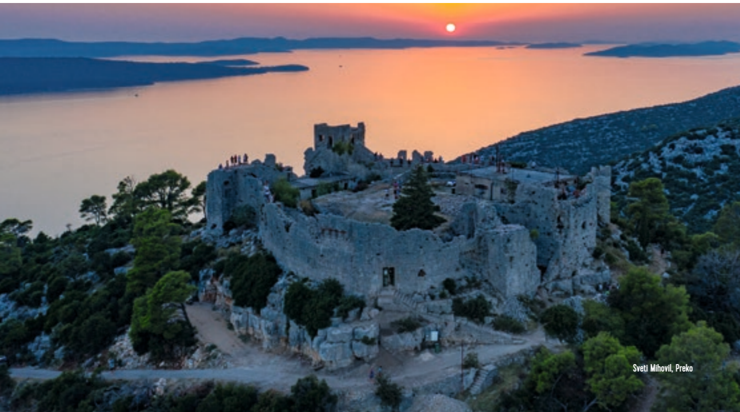
Sveti Mihovil, Preko

Da biste maksimalno iskoristili svoj boravak, preuzmite našu mobilnu aplikaciju. Ona vam pruža sve potrebne informacije, od detaljnih mapa staza do preporuka za najbolja mjesta za odmor i osvježenje.