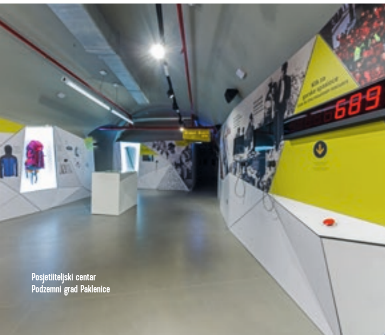
Posjetiteljski centar Podzemni grad Paklenice

Podzemni grad Paklenice ne pruža samo uvid ispod površine, već vas upozna s dubokom povezanosti prirode i kulturne baštine. Svaki korak unutar ovog podzemnog svijeta pomoći će vam da ostvarite dublju povezanost između vas i prirode koja vas okružuje. Doživite Paklenicu potpuno – od njenih skrivenih dubina koje otkrivete do visina koje osvajate.